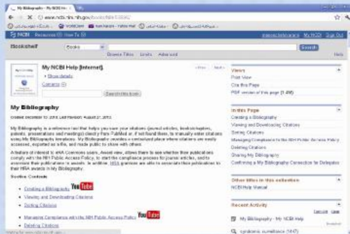
شکل ۹ مرحله هشتم

در این صفحه راهنمای ایجاد صفحه شخصی نشان داده شده است.