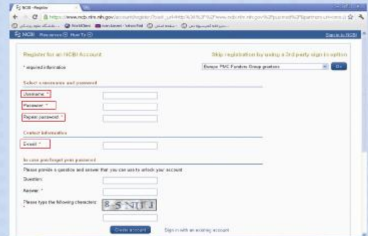
شکل ۳. مرحله سوم

گزینه های مربوط به فرم ثبت نام را مطابق شکل ۳ تکمیل نمایید.