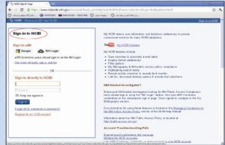
شکل ۲. مرحله دوم

با استفاده از گزینه Sign in to NCBI اقدام به ثبت نام نمایید.