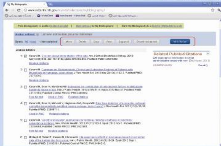
شکل ۸ مرحله هشتم

با استفاده از امکانات این صفحه می توان اقدام به اضافه نمودن، حذف، ویرایش، ارسال و به روز نمودن صفحه شخصی نمود.