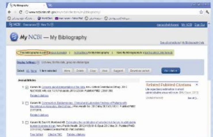
شکل ۷ مرحله هشتم

در این قسمت می توان امکان مشاهده شخصی یا انتشار عمومی و مشاهده اطلاعات پژوهشگر توسط سایر افراد را فراهم نمود.