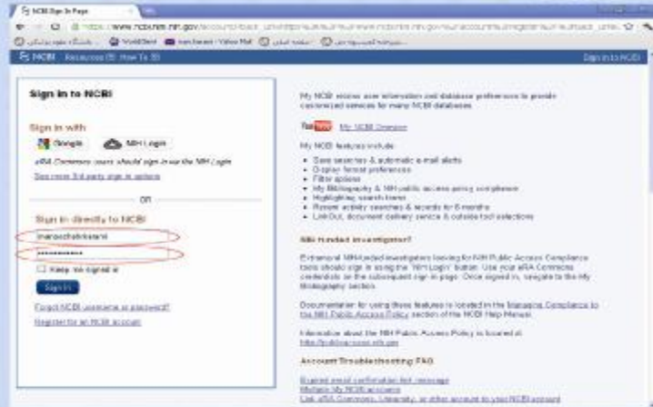
شکل ۳. مرحله چهارم

پس از اتمام مرحله سوم، در قسمت مورد نظر مطابق شکل زیر شناسه کاربری و کلمه عبور را وارد کنید.